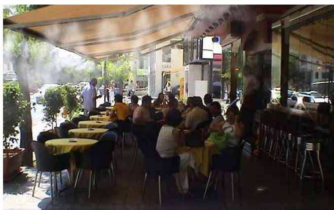
Equipo de enfriamiento por aerosolización al aire libre en una terraza.